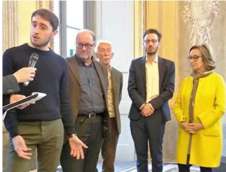
I vincitori del concorso di idee internazionale lanciato dalla Triennale di Milano

«Tre i punti di forza. Anzitutto il ruolo da protagonista nella rete di ville e dimore storiche lombarde. La Reggia col Parco ha poi il primato nella cultura del verde. Infine occorre sviluppare la fruizione della "Scala" della Formula 1»