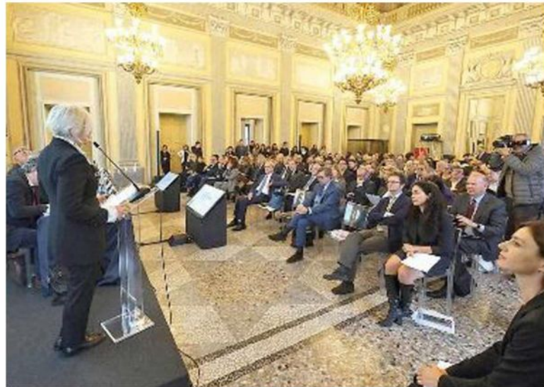
Un momento del convegno di ieri nel Salone delle feste della Reggia