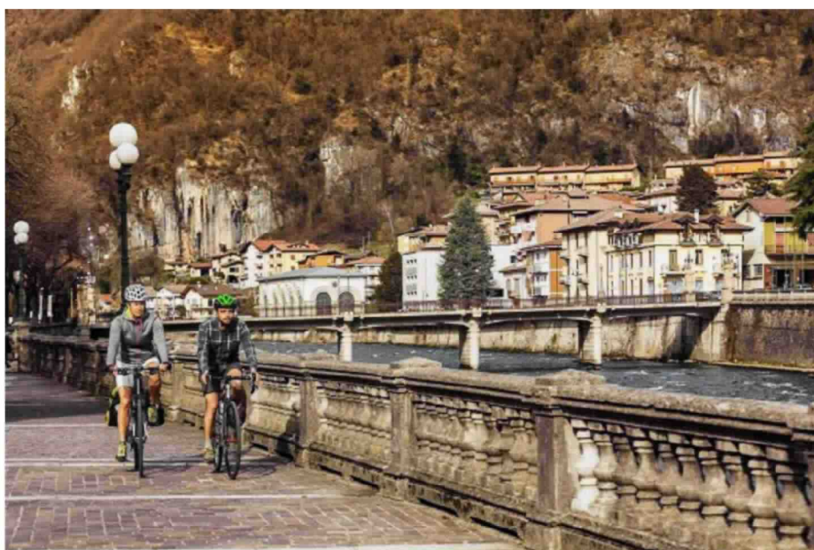
Val Brembana, San Pellegrino Terme

Il secondo percorso che suggeriamo è adatto proprio a tutti: parte da Ranica e raggiunge Clusone , una ciclovia di 31 Km tra sterrato e asfalto che comincia lungo la vecchia asse ferroviaria e prosegue per morbide pendenze lungo le sponde del fiume Serio . Numerose diramazioni permettono di visitare i paesini intorno. Tra le possibili digressioni, il Parco paleontologico di Cene , dove è perfettamente conservato lo scheletro del più antico pterosauro al mondo. A conclusione della pedalata, una buona idea potrebbe essere un tuffo ristoratore tra le salubri acque delle terme di San Pellegrino, immerse nel verde.