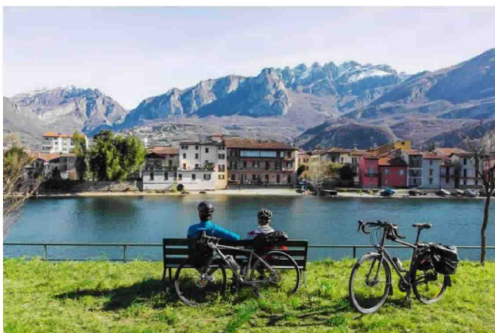
Lecco: Borgo Pescarenico, sosta lungo la ciclabile del fiume Adda

Questo itinerario si compone di 52 Km pianeggianti su una ciclabile che parte da Lecco e raggiunge Cassano d'Adda , scorrendo lungo gli argini studiati da Leonardo da Vinci in un connubio di natura, arte e ingegneria idraulica. Da Lecco si snoda il percorso che passa dal Civico Museo della Seta a Garlate e tocca Imbersago , dove un traghetto agganciato a un cavo sospeso tra le sponde trasporta i passeggeri tra le due rive. Dopo poco spuntano le fitte travature in ferro dello storico ponte San Michele a Paderno d'Adda, nei dintorni dell' Ecomuseo open air di Leonardo , tutto ciclo-pedonale. Alla fine della ciclabile lungo l'Adda, proseguendo sull' alzaia della Martesana , l'ultima gioia per gli occhi sono i meravigliosi giardini terrazzati di villa Melzi d'Eril.