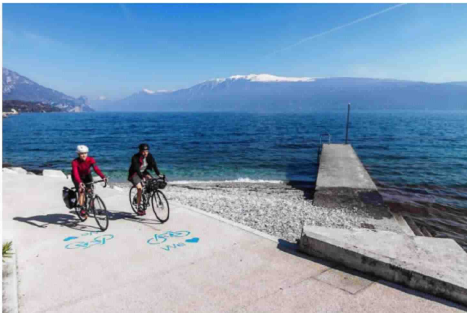
Brescia, Toscolano-Maderno Ciclabile il Lago di Garda

Tra cime alpine e ulivi argentei, il percorso da Salò a Cima Rest sono 45 Km impegnativi, adatti a chi ha