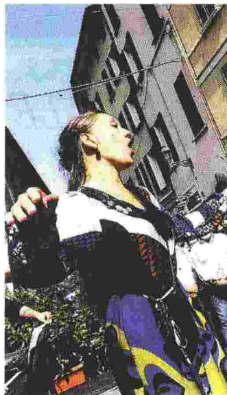
Ascolto. Musica per le strade

Tour. Per il terzo anno consecutivo Bresciatourism realizzerà poi un educational tour che porterà giornalisti italiani ed europei alla scoperta della città durante il particolare contesto della Festa dell'Opera e un programma di visite guidate per giornalisti francesi, selezionati attraverso la partnership con Explora e le Ferrovie di Stato francesi. Anche quest'anno Bresciatourism pro-