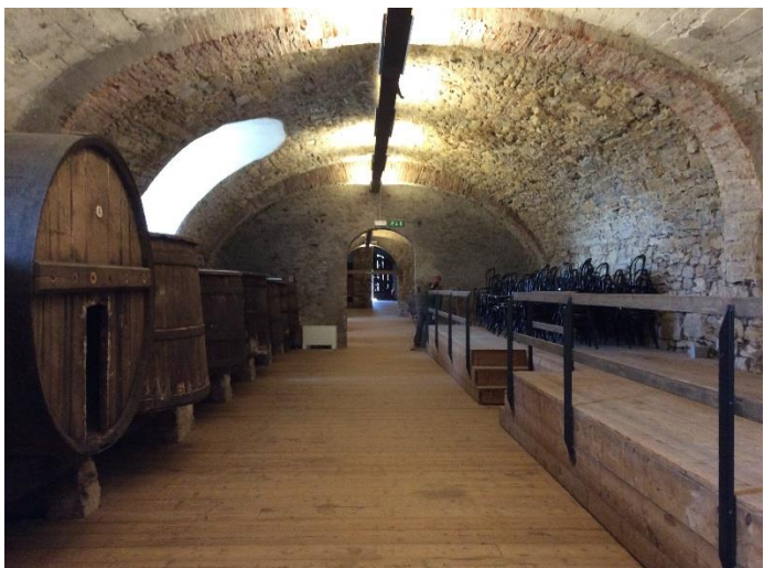
Cantina per sfilata, seconda sala