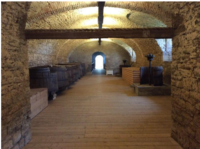
Cantina per sfilata, passerella ca 40 m