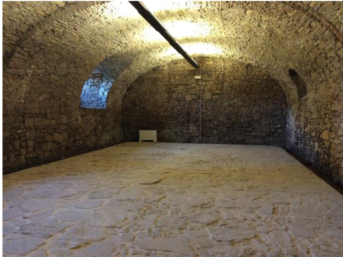
Sala backstage, Superficie: 7,5x15 m